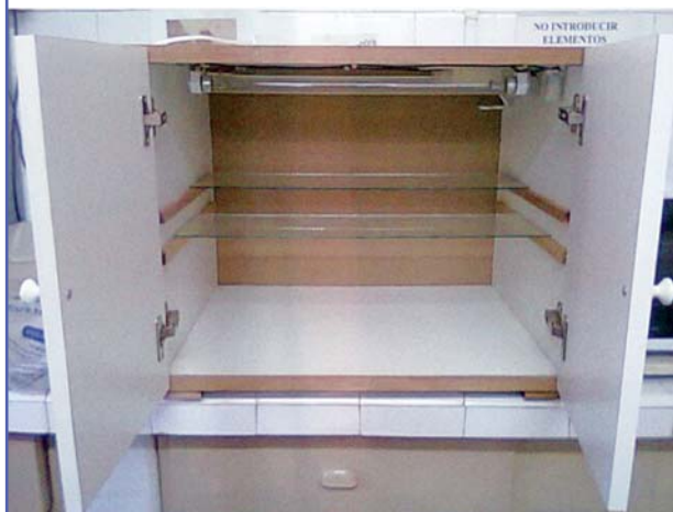
FIGURA 1 - Equipo utilizado para realizar el tratamiento de las carnes con luz UVC. En la parte superior se encuentran lámparas

Las determinaciones microbiológicas de las muestras tratadas y sin tratar (Control) se realizaron mediante hisopados de las superficies cárnicas a diferentes tiempos de